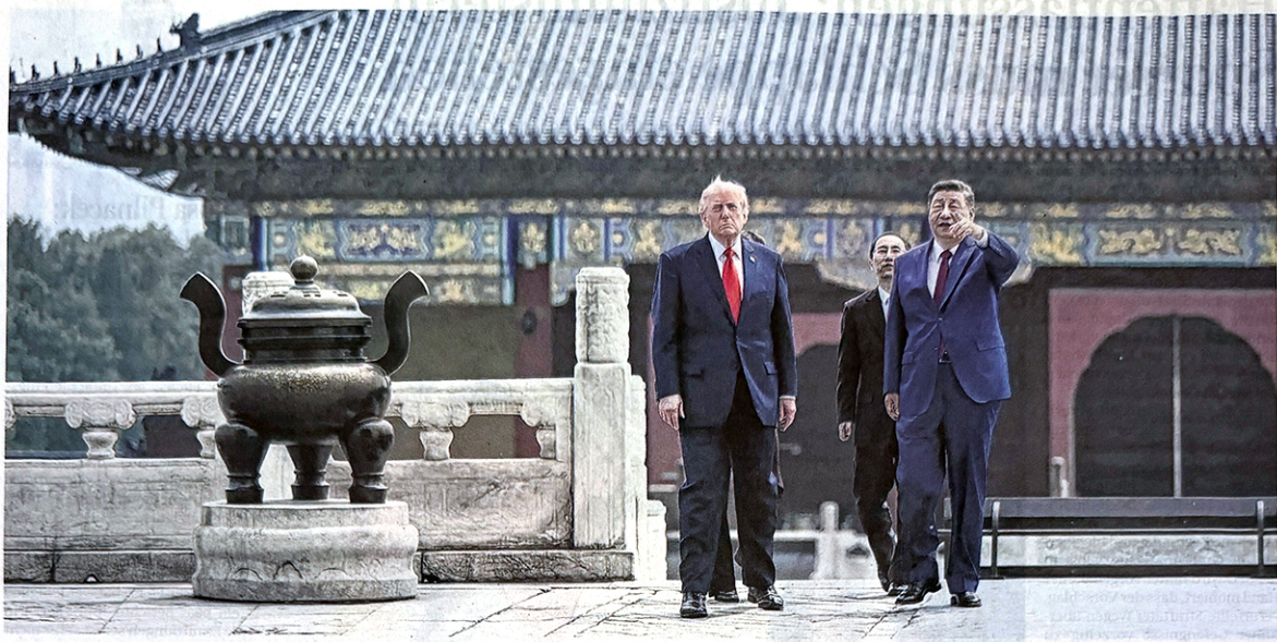
Geht ihren Ländern die Zukunft? US-Präsident Donald Trump (li.) und Chinas Staatschef Xi Jinping bei ihrem Treffen im Mai